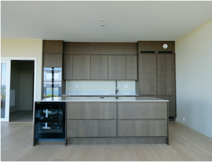
Det er høy standard på kjøkken og våtrom.

med påkostede materialvalg og et eksklusivt preg, sier Knatterød.