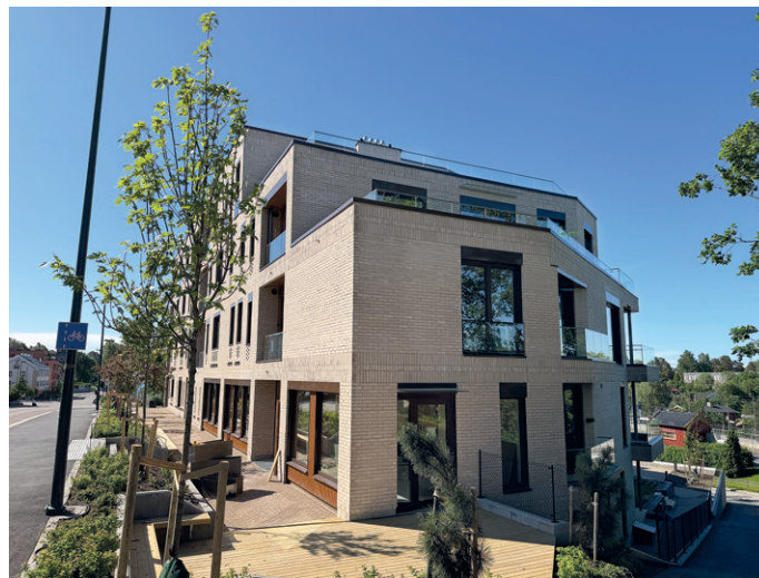
Nybygget er i fem etasjer.

vestvendt veranda, mens leilighetene i underetasjen har plattning mot felles gressplen med sittegrupper og grillmuligheter.